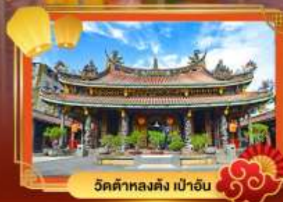
วัดต้าหลงตง เป่าอั้น