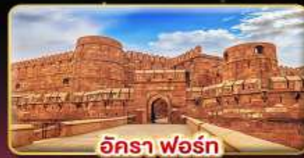
อัครา ฟอรั่ม