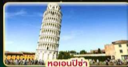
หออนปีซ่า