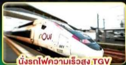
นั่งรถไฟความเร็วสูง TGV