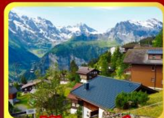
หมู่บ้านเมอร์สเรน