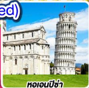
หอนอนปิซ่า