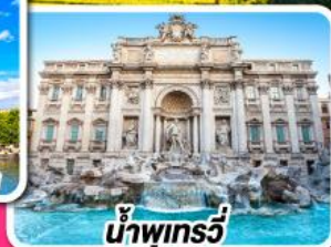
น้ำพุทรวี่