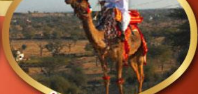
ฟรี ژیوซู เมืองมันทอวา ราคาเริ่มต้น