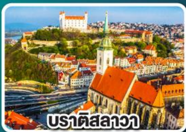
ปราทิสลาวา