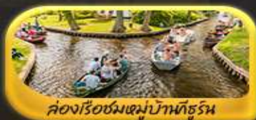
คลองเรือชมหมู่บ้านกังหัน