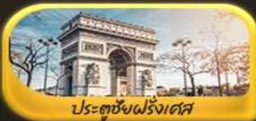
ประตูชัยฝรั่งเศส

พิเศษ!! ล่องเรือแม่น้ำแซนชมเมือง โดย บาโด มุช