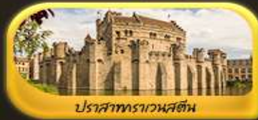
ปราสาทราเวนสตัน