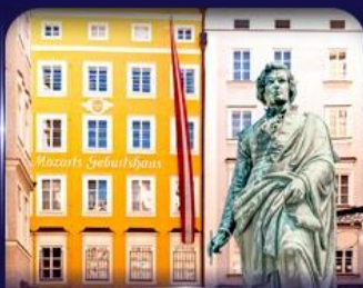
บ้านเกิดโมสาร์ท ซาลซ์บูร์ก