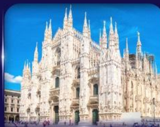
เซ็กวันวิหารดูโอโม มิลาโน