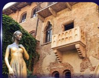
เขื่อนบ้านจูเลียต เวิร์นา