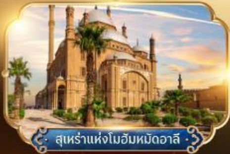
สุเหร่าแห่งโมฮัมหมัดอาลี