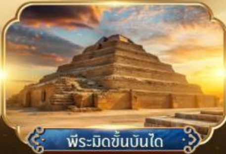
พีระมิดขั้นบันได