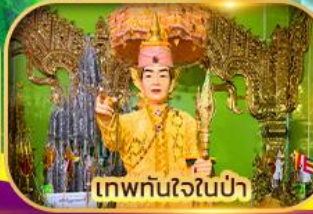
เทพทันใจในป่า