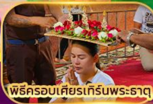
พิธีครอบเศียรเทีร์นพระธาตุ