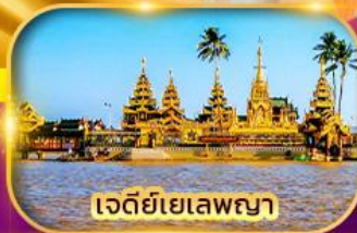
เจดีย์เยเลพญา