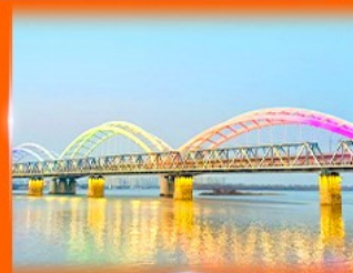
สะพานรถไฟผืนโจว