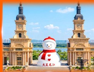
ตุ๊กตาหิมะยักษ์ ฮาร์บิน