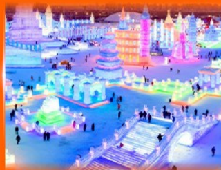
เที่ยว ICE & SNOW WORLD