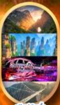
พรีเซ็นเลือกซื้อ Option เสริม