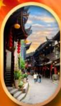
เมืองโบราณฟูหลงเจี้ยน