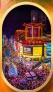
ถนนคนเดินซิงลู่