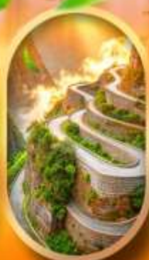
หุบเขาป้ายช้าง