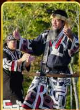
พิพิธภัณฑ์โอนู