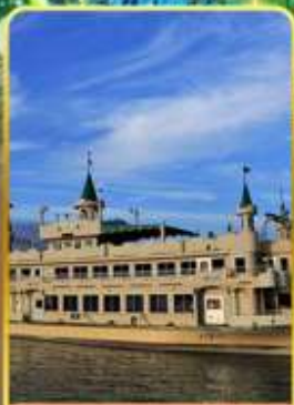
ล่องเรือทะเลสาบโทยะ