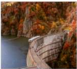
เขื่อนโซเซเดียว