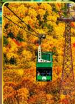
กระเช้าคุโรดากะ