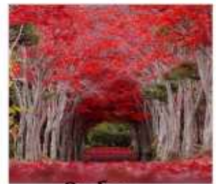
ชิราโอกะ (จุมงคิโบนเมเน็ค)