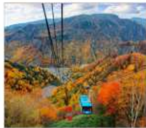
น้ำังกระเข้าคุดโรดาเกะ