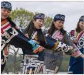
พื้พื้รภัณฑท์ไอนุ UPOPOY