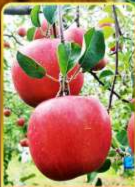
เก็บแอปเปิล