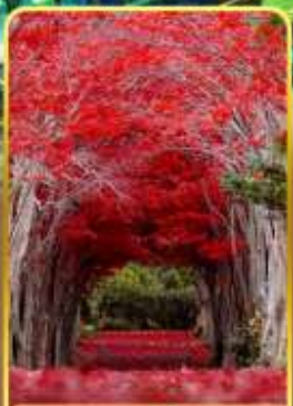
สวนฮิราโอกะ