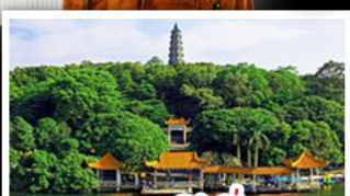
ภูเขาชิงชิว