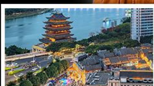
ถนนคนเดินสามตรอกสองซอย