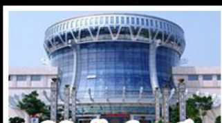
พิพิธภัณฑ์กังวานสี

สวนสนุก FANTASYLAND - หมู่บ้านสไตล์ยุโรป พิพิธภัณฑ์กังวานสี - ถนนคนเดินสามตรอกสองซอย ท่าเรือกิ่งจื่อ - ศาลเจ้าแม่กวนอิมพันกร เมนูพิเศษ อาหารกังวานตุ้ง , สุกีชาบูหม่าล่า