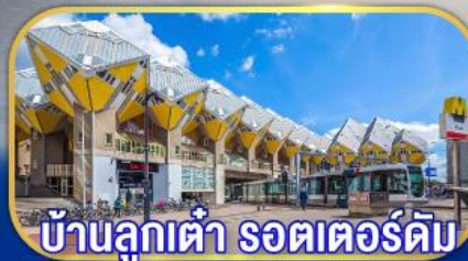
บ้านลูกเต๋า รอตเตอร์ดัม

เยือนเมืองเก่าแก่ยุโรปครบถ้วน เก็บไฮไลต์กลุ่มประเทศเบเนลักซ์ กับการบินไทย บินตรงอัมสเตอร์ดัม