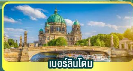
เบอร์ลินโดม