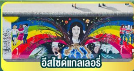
อิสไซด์เทลาเลอร์