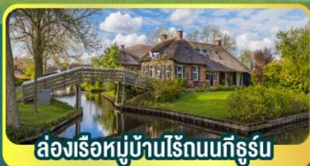
ล่องเรือหมู่บ้านไรน์บนทีกูร์น