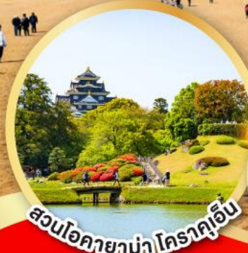
สวนโอคายาม่า โคราคูเอ็น