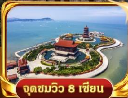
จุดชมวิวกว 8 เซียน