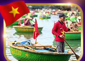
เรือกระด้ง หมู่บ้านกิมทาน