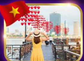
เชิควินสะพานแห่งความรัก