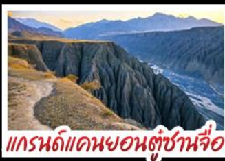
แกรนด์แคนยอนตุ๋ชานจื่อ

ทะเลสาบโซหลู่มู่ - คานาสือ แกรนด์แคนยอนตุ๋ชานจื่อ ตลาดแกรนด์บาซาร์ - หมู่บ้านห่อมู่