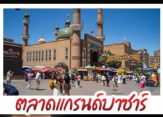
ตลาดแกรนด์บาซาร์