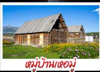
หมู่บ้านห่อมู่