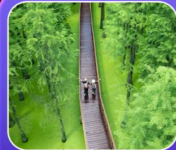
"ป่าสนชิงซาน"

T2G-HGH01GJ Welcome Hangzhou...หังโจว ฉู่โจว ฉู่หยวน ช่างเหรา หุบเขาเทวดา 5D 4N (GJ)