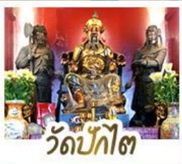
วัดป้ก้โต