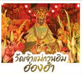
วัดเจ้าแม่กวนอิมอ่องฮ่า