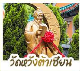
วัดแสด่วงต้าเซ้งน