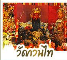
วัดกวนน้ไท