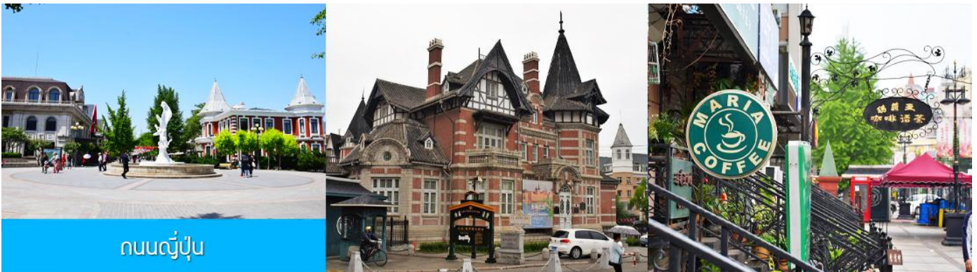
ถนนญี่ปุ่น