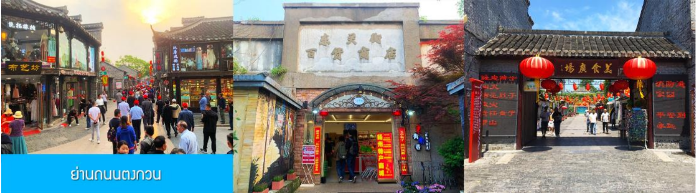
ย่านถนนตงกวน

ชม จัตุรัสชิงไห่ 星海广场 เป็นจัตุรัสขนาดใหญ่เป็นแลนด์มาร์คสำคัญของเมืองต้าเหลียน สร้างขึ้นเพื่อเฉลิมฉลองในโอกาสที่รัฐบาลอังกฤษคืนเกาะฮ่องกงในให้จีนในปี ค.ศ. 1997 ตั้งอยู่ชายฝั่งทะเลในเมืองต้าเหลียน เป็นจัตุรัสใจกลางเมืองที่ใหญ่ที่สุดในโลกและ เป็นแลนด์มาร์คของเมืองต้าเหลียน รายล้อมด้วยตึกระฟ้าที่ทันสมัย ภายในมีบ่อน้ำพุดนตรี ลานหญ้าขนาดใหญ่ และลานกว้างสำหรับจัดกิจกรรมกลางแจ้ง อาทิ เทศกาลเบียร์นานาชาติ การแข่งขันวิ่งมาราธอน งานแฟชั่นนานาชาติเมืองต้าเหลียน ฯลฯ