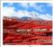
ไร่ชางอีหมว