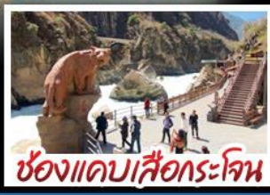
ช่องแคบเสือกะโจน