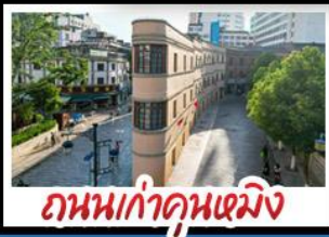
ถนนเก๋าคูหนิง