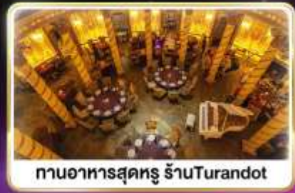
กานอาหารสุดหรู ร้านTurandot