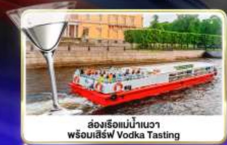
ล่องเรือแม่น้ำแคว พร้อมเสิร์ฟ Vodka Tasting