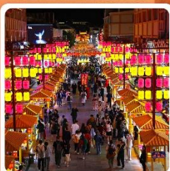
ตลาดกลางคีนซาโจว