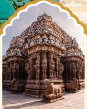
กาญจิปรัม