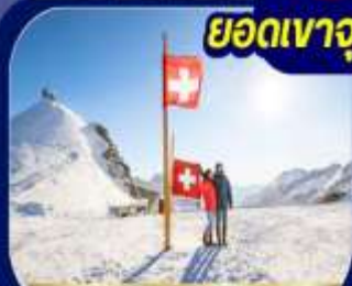
ยอดเขาวงพร้าว