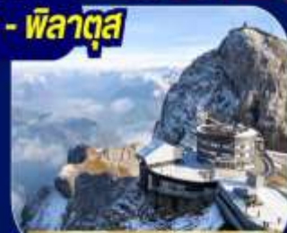
ยอดเขาพิลาตุส

นั่งรถไฟ Bernina Express เส้นทางรถไฟสายมรดกโลก