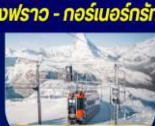
กอร์เนอร์กรัท