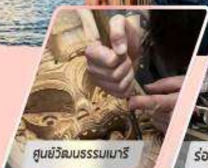
ศูนย์วัฒนธรรมเมารี