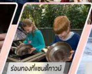
ร้อนท้องที่แซนดี้ทาวน์