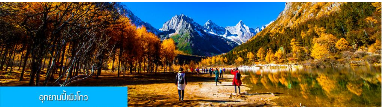
อุทยานเป่ย์เฟิงโกว