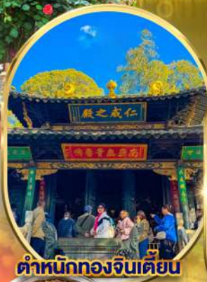
ตำหนักทองจินเตียน