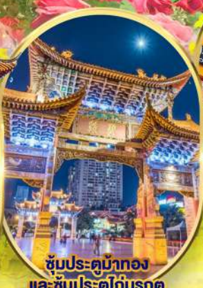
ซุ้มประตูม้าทอง และ ซุ้มประตูไถ่บรกด