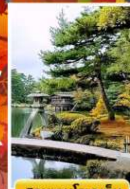
สวนเคนโระคุเอ็ง