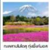
ทะเลสาบโมโตสุ ทุ่งพืชมอส