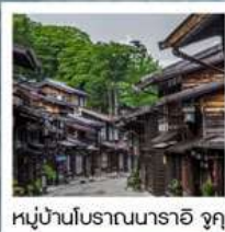
หมู่บ้านโบราณนารายิ จุกุ