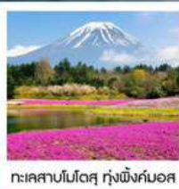
ทะเลสาบโมโตสุ ทุ่งพืชมอส