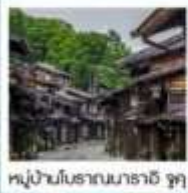
หมู่บ้านโบราณนาราอิ จุกุ