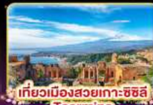
เที่ยวเมืองสวยเกาะซซิลี Taormina