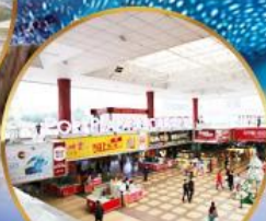
ตลาดกึ่งเป่ย