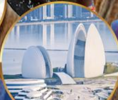
โรงแรมหรูไฮมุก