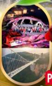
OPTION 1: ไร่มังกรพญาริงจอกขาว OPTION 2: สระพญากิ่งจางเจียเจีย