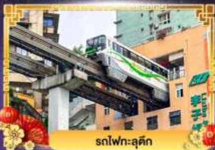
รถไฟฟ้าลัด