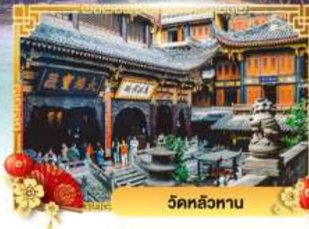
วัดหลัวฮาน