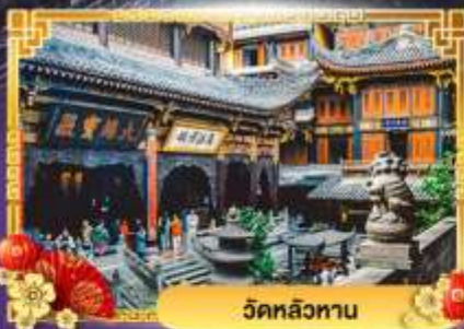
วัดหลิวทาน