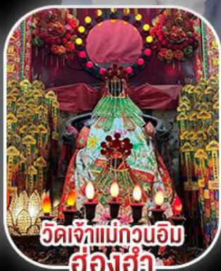
วัดเจ้าแม่กวนอิม ฮ่องฮำ