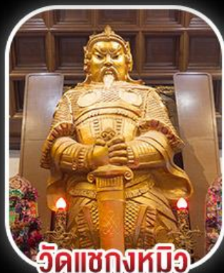
วัดเขกหงหมีว

สวนสนุก CHIMELONG SPACESHIP PARK เจ้าแม่กวนอิมรีพลีสมาธ - เจ้าแม่กวนอิมฮ่องฮำ วัดเขกหงหมีว - พระใหญ่องปิง+กระเช้า เมนูสุดพิศษ!! เป้าอ้อ+ไวน์แดง , ห่านย่าง