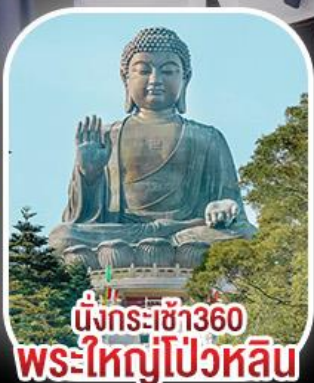
นั่งกระเช้า360 พระใหญ่โป้วหลิน