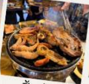
ปิ้งย่าง