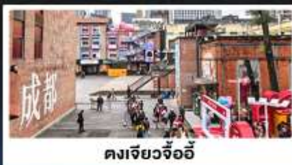
ตงเจียวจ้ออี้