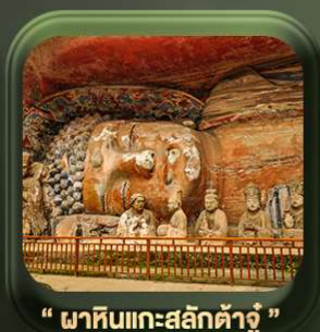
“ พาทินแกะสลักต้าจู้ ”