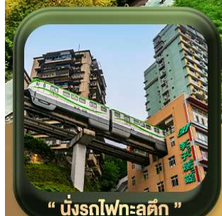
“ นั้รทไฟทะลุดัก ”

บินตรงลงอุ้หลง • อุ้หลง หลุมฟ้าสะพานสวรรค์ • ระเบียงแก๊ว • อุทยานเขานางฟ้า หงหยาดัง • นั้รทไฟทะลุดัก • ศาลาประชาคม (ด้านนอก) • หลงหมินฮ่าว มรดกโลกพาทินแกะสลักต้าจู้ • วัดหลิวอัน • ตึกตะเกียบ • ถนนคนเดินเจียฟ้างเป่ย