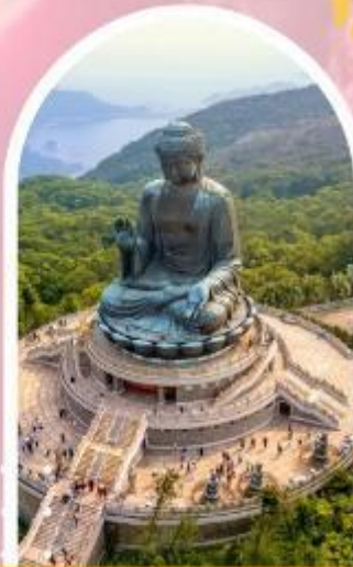
นั่งกระเช้ามองปิง นมัสการพระใหญ่โปวหลิน