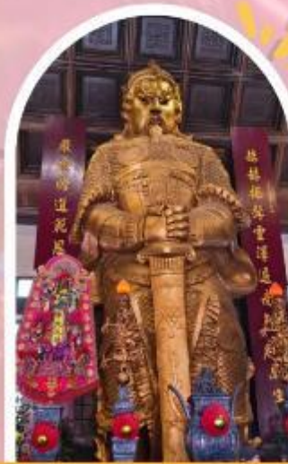
วัดแชกง ขอพรโชคลาก การเงิน และธุรกิจ