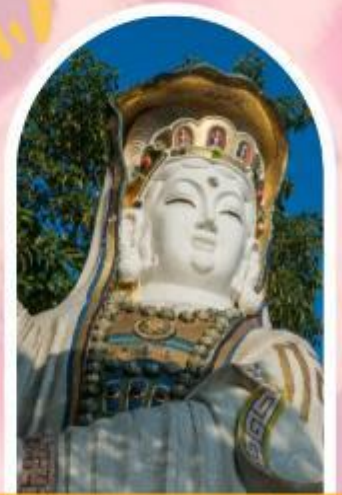
ริฟลิสเบย์ รับพลังงานดี เสริมพลังดวงจัญ