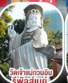
วัดเจ้าแม่กวนอิมรีพัลส์เบย์