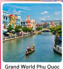
Grand World Phu Quoc