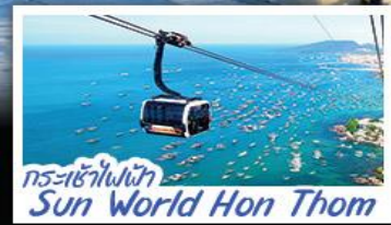
กระเช้าไฟฟ้า Sun World Hon Thom