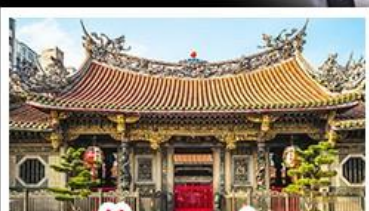
วัดเจหลงซาน