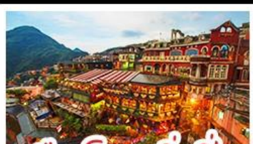
เมืองโบราณจีวเฟิน