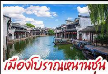
เมืองโบราณหนานชุน