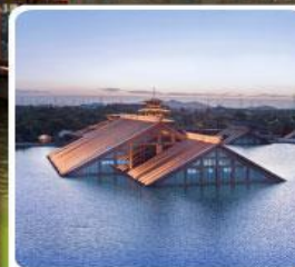
พิพิธภัณฑ์ไต้หน้ำ กวงฟู่หลิน