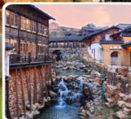
เมืองโบราณเหยาหู